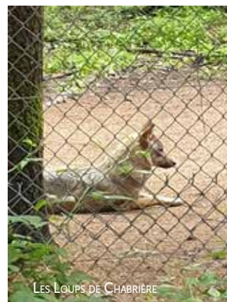
LES LOUPS DE CHABRIÈRE