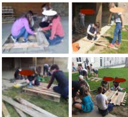
CONSTRUCTION DE LA BOÎTE À DON