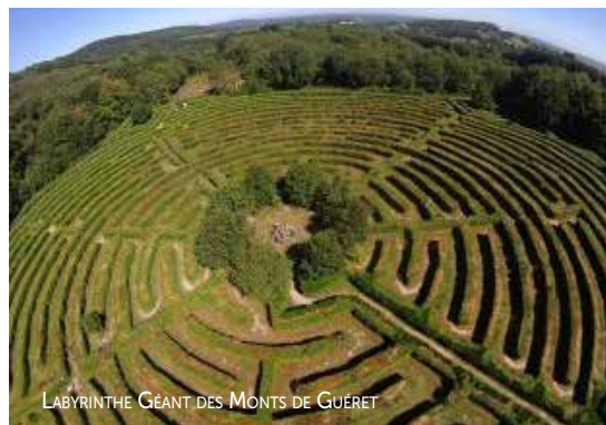
LABYRINTHE GÉANT DES MONTS DE GUÉRET