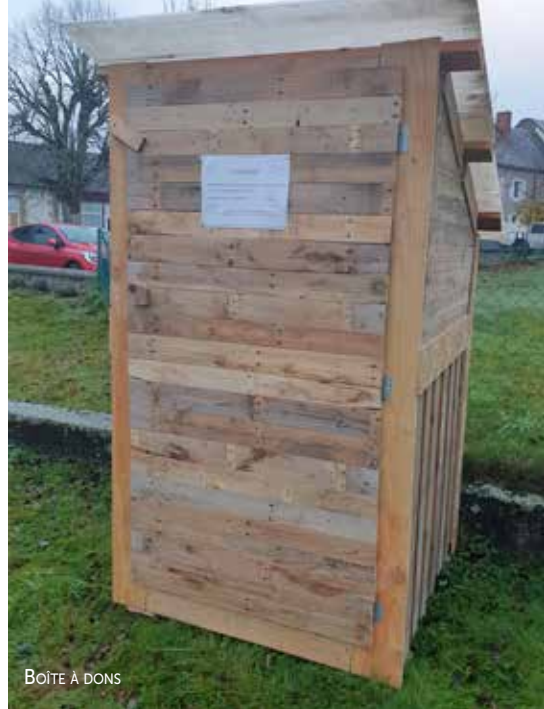
BOÎTE À DON

L'année 2021 se terminera par la participation au marché de Noël de la commune le 17 décembre.